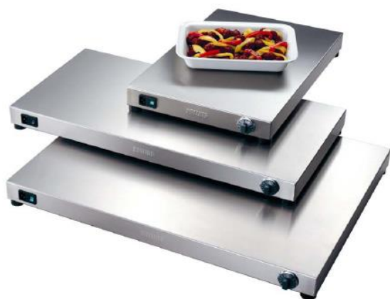
Värmehäll utan vulstkant Modell 3113400, 3113500, 3113600