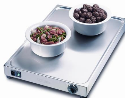
Värmehäll med vulstkant Modell 3112800

Hallins Sales AB Fabriksvägen 1 S-599 33 ÖDESHÖG